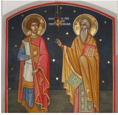
Sfinții Doctori fără de arginți Pantelimon și Ermolae (icoană din incinta Așezământului Christiana)